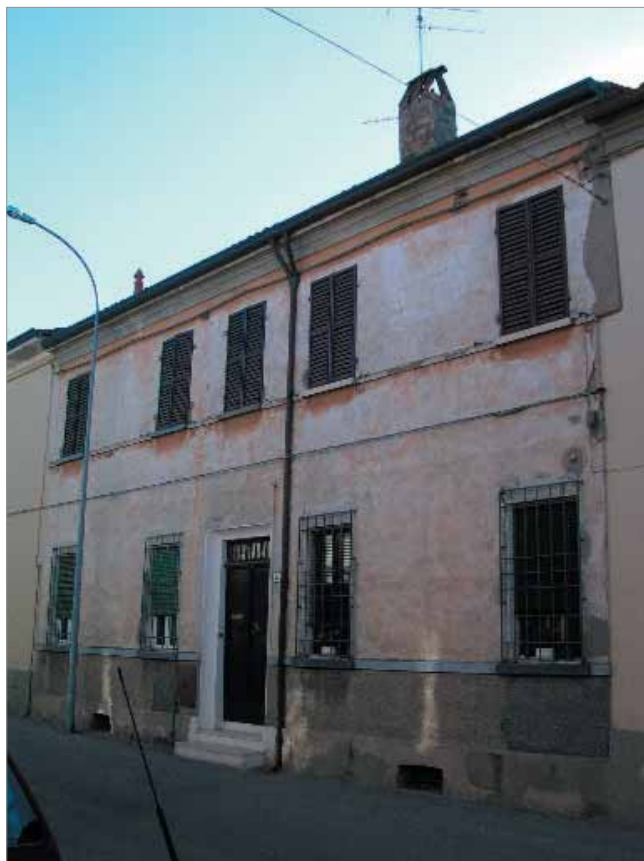
Via Cadorna 47 Fronte Principale